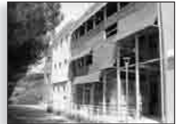
Le Centre d'Art Polyphonique ouvre enfin ses portes