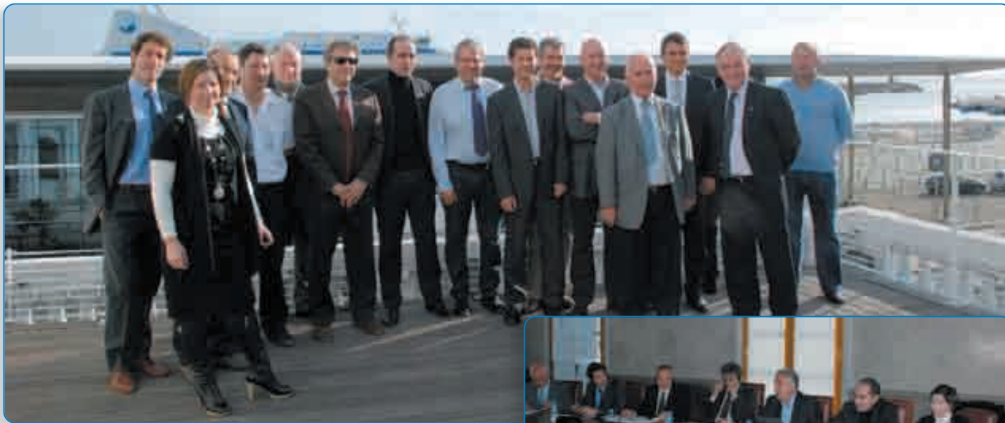
Etape bastiaise pour les partenaires du projet réunissant 4 ports italiens et le port de Bastia