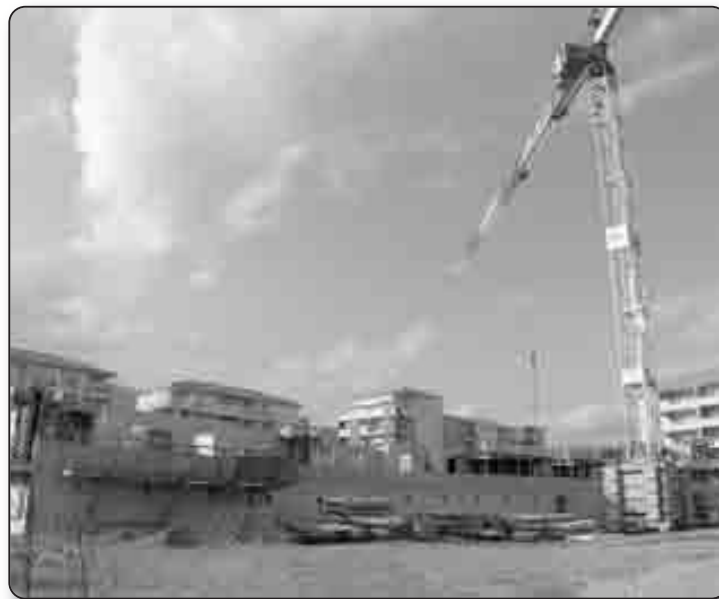
Élévation du bâtiment I de la résidence Mariana Grand Parc, à Lucciana

Ce faisant, il trace sa route tout en prenant de la hauteur.