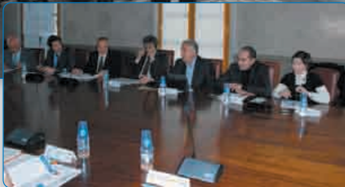
Séminaire, à la CCI de Haute-Corse, pour un point d'étape et des échanges d'expériences

La nature a horreur du vide et c'est donc un jour de grand vent qu'un séminaire portant sur le projet «Vent et ports» s'est dernièrement tenu à la CCI de Bastia, impliquant différents partenaires dont, bien sûr, les autorités portuaires bastiaises, mais aussi celles de Gênes. Toutes étaient réunies pour témoigner du vent de réussite qui souffle sur un projet de coopération mais aussi d'ingénierie technique et scientifique unique destiné, via prévisions météorologiques et étude du vent, à améliorer la sécurité dans les ports.