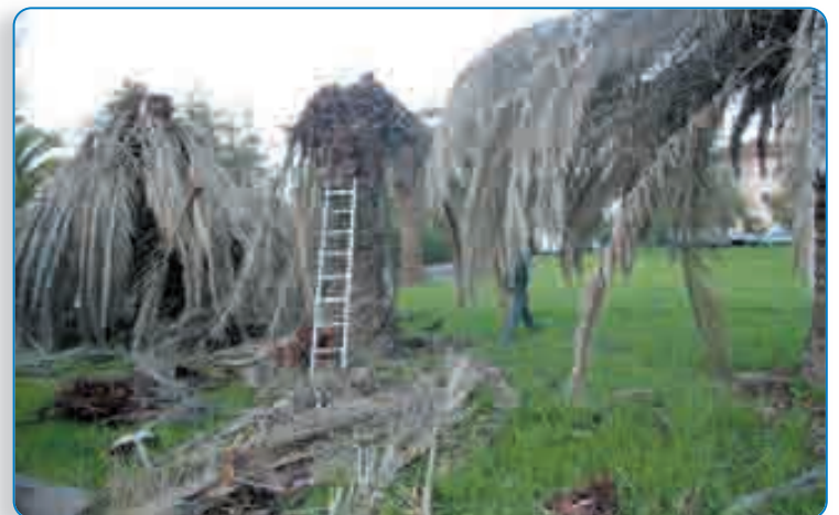
Dévastés par le coléoptère, les palmiers perdent leurs palmes... À ce stade, l'arbre est perdu

Mais la question de savoir qu'elle sera la progression du tueur de palmier, elle, reste entière.