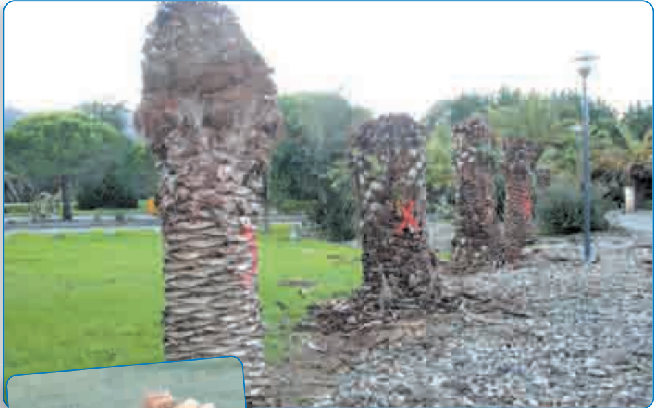
Des palmiers sans palme... Une image désormais récurrente en Costa Verde

Les palmiers de Costa Verde n'ont pas été épargnés malgré l'état d'urgence déclaré pour faire face à la grave menace de disparition complète qui les menaçait face à la présence du charançon rouge du palmier, dont un foyer avait été découvert en septembre 2006 par la FREDON Corse. L'alerte donnée était explicite : le charançon rouge était susceptible de causer des dégâts considérables sur les palmiers de la région, et l'action menée par la FREDON consistait à suivre la population de ce ravageur dans la région afin de maîtriser les foyers existants et potentiels.