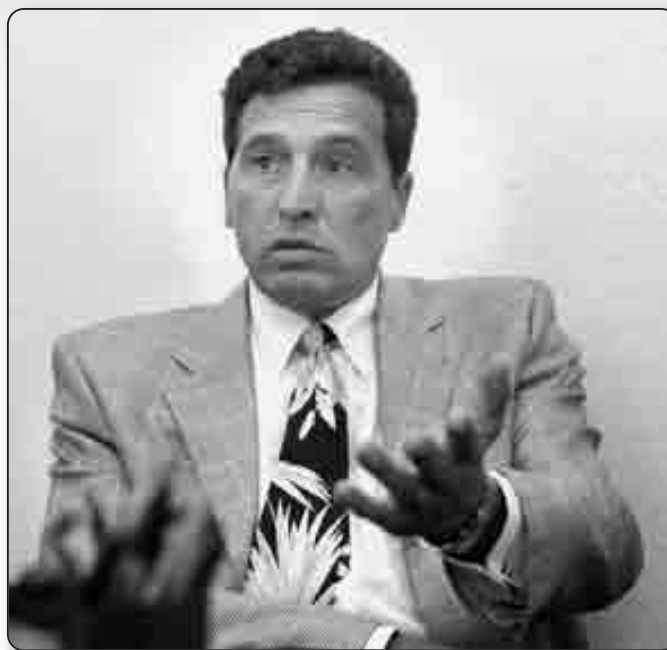
Le Président du directoire de la SNCM

cela ne change rien si ce n'est que la CDC pourrait être actionnaire majoritaire. Et c'est même rassurant d'avoir comme partenaire un opérateur qui n'est pas soumis aux marchés financiers. Cela nous donnera les marges de manœuvre nécessaires face aux investissements que nous aurons à faire pour poursuivre l'évolution de notre modèle économique». Restent plusieurs inconnues : la société sera-t-elle retenue par la future DSP ? Si oui, le sera-t-elle dans le périmètre actuel sachant que l'Office des Transports Corses n'a plus les moyens de la financer ? «95% de ce qui se consomme ou se fabrique sur l'Île passent par la mer. Le bon fonctionnement et le développement économique de ce territoire reposent sur une continuité et une régularité à l'année, et non de manière saisonnière. A fortiori pour les matières premières. La structuration de la DSP doit se faire au niveau du fret», donne-t-il en guise de réponse. La société aura-t-elle, dans une conjoncture de pénurie de capitaux, les moyens de financer (un plan de développement estimé à 700 M€) sa nécessaire adaptation qui passera par un renouvellement de sa flotte et un changement du schéma d'exploitation ? Aura-t-elle la possibilité de conclure un nouveau pacte social dans cette entreprise réputée pour ses rapports de force souvent musclés ? Et enfin, si la SNCM n'obtient pas la DSP ? «C'est clair, on disparaîtra».