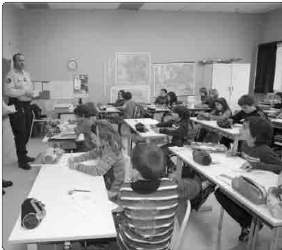
L'heure de l'annonce des résultats à l'école du Puntichju de Santa Lucia di Moriani

Le permis piéton est une initiative nationale de prévention du risque piéton chez les enfants de 8-9 ans qui avait été lancée en octobre 2006. Mais au fil des ans, les bonnes habitudes se sont perdues et le permis piéton est devenu quelque peu désuet ! Jusqu'au regain d'intérêt marqué cette année pour cet examen de base qui, au-delà des règles de circulation piétonne, enseigne aux enfants le sens de la responsabilité individuelle, grâce à un ensemble de précautions, de réflexes et d'astuces supplémentaires leur permettant d'assurer leur propre sécurité.