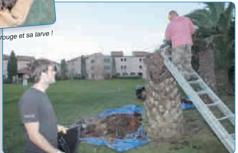
Les entreprises CMO Industrie et Costa Verde Natura ont été missionnées pour tenter l'impossible !

Le coléoptère, le charançon rouge ( Rynchophorus ferrugineus ) se nourrit et se reproduit essentiellement dans le cœur de toute la famille des Palmae (palmiers). Il provoque un véritable désastre en détruisant systématiquement le patrimoine végétal.