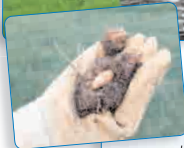
Le charançon rouge et sa larve !