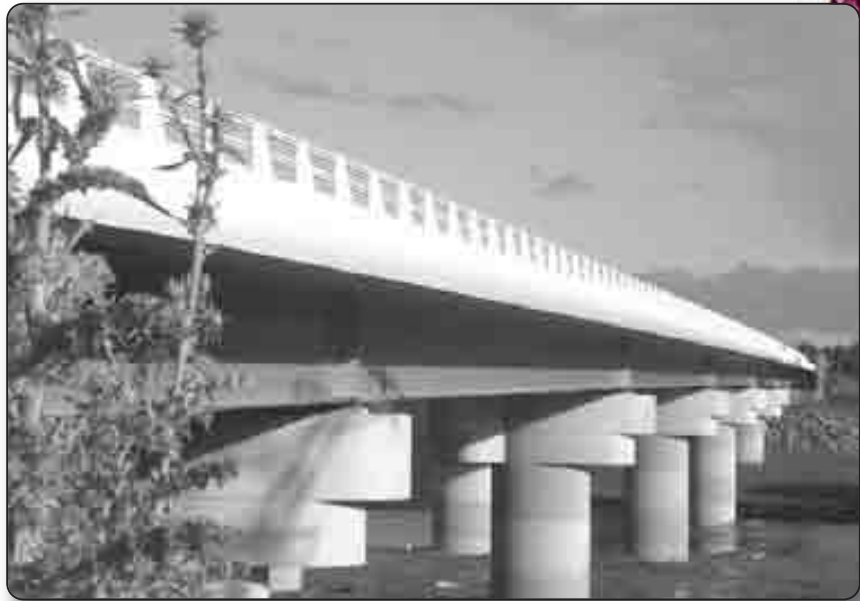
Le Pont du Golo, un chantier sur lequel est intervenue la SAS Terraco

Depuis, d'autres programmes immobiliers ont fleuri : celui de Mariana Grand Parc, sur la commune de Lucciana, dont la moitié des logements (450 en tout) a déjà été livrée, le reste étant en cours de réalisation; celui d'Acqua Linda, résidence de touris-