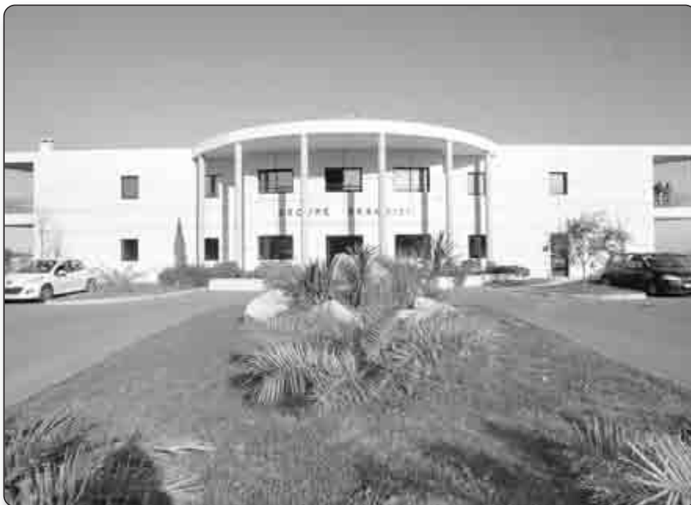
Le siège du groupe Brandizi est installé au cœur de la ZA de Folelli