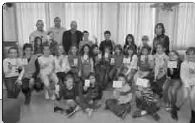
L'heure de l'annonce des résultats à l'école du Puntichju de Santa Lucia di Moriani

École du Petricciu à Cervioni, Marina d'Osari à Santa Maria Poghju, U Puntichju à Santa Lucia di Moriani, Moriani-Plage, San Giulianu , ont été visitées tour à tour, pour une leçon d'éducation civique dont les jeunes publics ont parfaitement ciblé l'intérêt. Et l'exercice a été couronné de succès, à l'image du taux de réussite à l'examen !