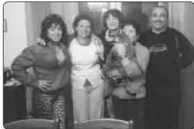
Une partie de la dynamique association « U Felinu »

«Nous aidons au mieux les gens qui rencontrent des difficultés pour stériliser des communautés de chats avec l'aide de la Fondation Bardot et de 30 millions d'amis».