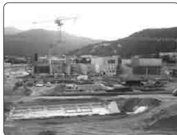
Construction de la nouvelle centrale EDF à Lucciana

la Corse et de son développement en améliorant notamment les infrastructures, via une meilleure accessibilité et une plus grande sécurité des routes. En remportant le marché de la nouvelle voie Borgo-Vescovato, c'est le plus